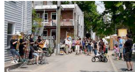
ruelle de Limoilou, Qc